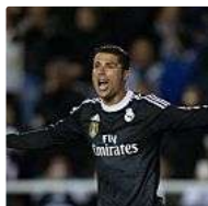
Cristiano Ronaldo la vuelve a liar en su celebración de gol