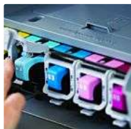
Todo lo que necesitas saber para ahorrar al imprimir (I)