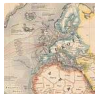
Mapa de los cables submarinos que conectan el mundo