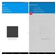
Mata píxeles y ahorra batería con Pixel Off